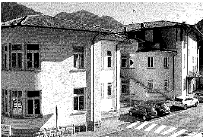
Tione, all'ospedale oggi i volontari del Tribunale dei diritti del malato

tito il rispetto dei fondamentali diritti dei cittadini, sanciti nella Carta Europea dei diritti del malato. «Perché ciò avvenga - spiega la responsabile delle Giudicarie - sono necessari la collaborazione e l'impegno di cittadini, operatori sanitari, associazioni, servizi pubblici e privati, quali "portatori d'interesse"». La presenza dei volontari di Cittadinanzattiva - Tribunale diritti del malato nell'ospedale di Tione è l'occasione per informare i cittadini, rispondere alle loro domande e consegnare loro la Carta Europea dei diritti del malato e altri opuscoli tematici. (w.f.)